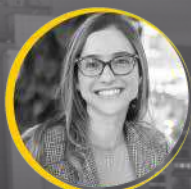
Luz Ángela González

Alcalde de Medellín 2004-2007 y Gobernador de Antioquia 2012-2015