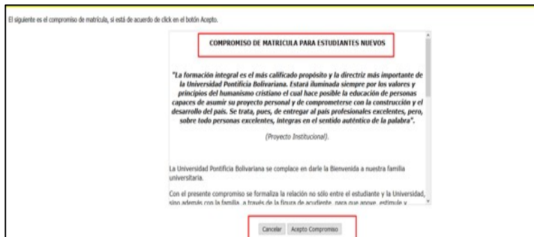
Figura 13: compromiso de matrícula

“La matrícula se perfecciona cuando el aspirante/estudiante haya cumplido con todos los requisitos exigidos y genere el compromiso de matrícula”.