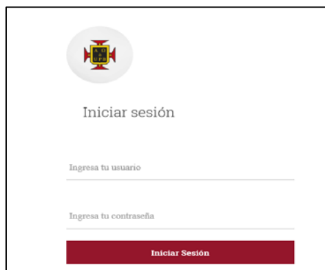
Figura 1: ingreso autoservicio