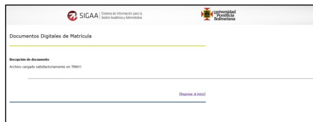
Figura 6: Carga exitosa del archivo.

Si ya tiene el archivo de la foto en JPG, realice la carga mediante el botón examinar, y luego el botón “Registrar archivo” para que posteriormente se presente el mensaje “Recepción de documento” y continúe cargando el archivo dando click en el link de la parte inferior “Regresar al inicio”