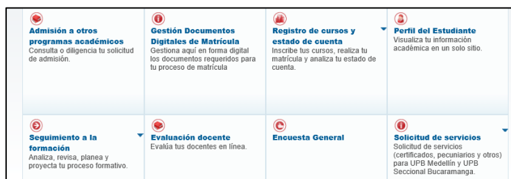
Figura 3: Menú estudiantes/ Gestión Documentos Digitales de Matrícula.